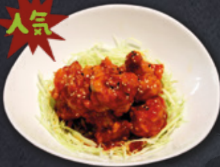
ヤンニョムチキン