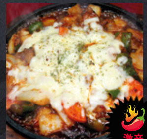
チーズブルダック