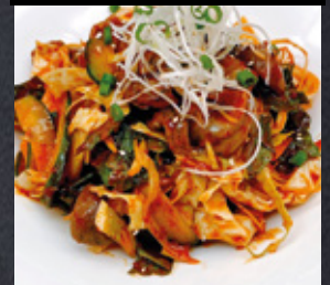
つぶ貝和え(ゴルベンイ)